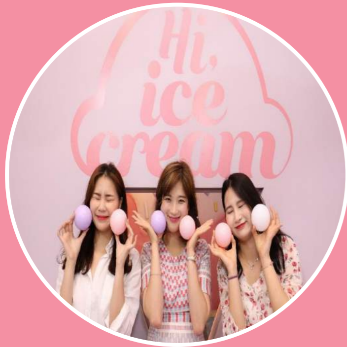
01 사진 찍기 명소