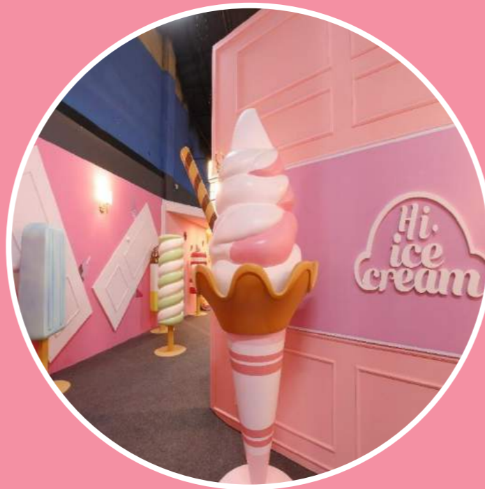
02 친숙한 아이스크림